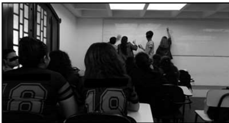
Figura 5: Melhora na interação dos alunos durante a aplicação do jogo.