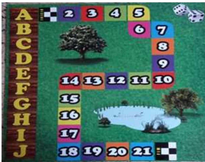
Figura 1: Tabuleiro composto de dez casas verticais de A a J e vinte e uma casas numeradas de 2 a 21.

Avaliação do processo de interação entre alunos e as atividades propostas pelo jogo “As casas da Física” foi feita de forma descritiva com base no produto educacional apresentado na Figura 1 e o processo de avaliação do jogo veio após a análise dos questionários respondidos pelos alunos. Os participantes foram informados sobre o objetivo da pesquisa e assinaram o Termo de Consentimento Livre e Esclarecido (TCLE). O resultado dessas análises de conteúdo foi tratado de forma qualitativa que, segundo Oliveira (2009) [16], deve-se adotar uma orientação (ou obrigação) ao comportamento humano por meio de forças ou fatores internas e externas os quais uma pessoa fique sujeita, para que se obtenha um determinado resultado. Todas as atividades foram realizadas em uma escola da rede privada da região metropolitana de Belém/PA.