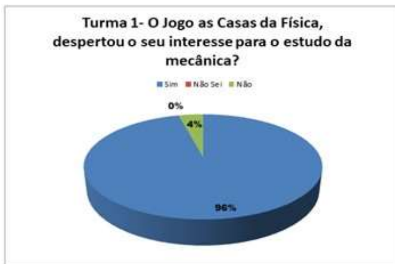
Figura 4: Resposta dos alunos quanto ao interesse dos conteúdos de física após a aplicação do jogo.

À medida que os alunos passaram a entender melhor determinados conteúdos, foi obvio que seu interesse pela Física aumentasse após o jogo, com um percentual médio de 96% dos discentes entrevistados, como mostrado na Figura 4.