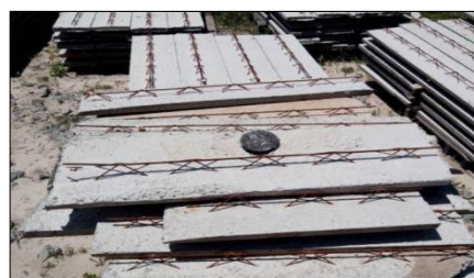
Figura 4: Peças da laje treliçada

Quanto aos pontos frágeis, a empresa não estava utilizando gabarito metálico de portas e janelas e nem escantilhões, pois estava aguardando a confecção dos mesmos. Os gabaritos de portas e janelas dão melhor precisão aos espaços destinados a esses elementos.