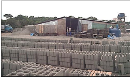
Figura 5: Fábrica de blocos

Quanto ao layout de canteiro, a escolha da instalação da fábrica de blocos (Figura 5) no terreno vizinho ganhou destaque como decisão acertada de implantação de canteiro, contribuindo para um melhor transporte na obra. O transporte foi um dos pontos fortes do canteiro, conforme exemplos de boas práticas da categoria de acesso. Os fatores que mais contribuíram para isso foram a boa variedade de máquinas, a boa distribuição das centrais de argamassa pelo canteiro, a localização da fábrica de blocos no terreno vizinho e a paletização de blocos, Figura 6.