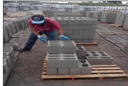
Figura 6: Paletização de blocos

Porém, no processo executivo encontraram-se muitas falhas, principalmente quanto ao cumprimento do PES de alvenaria.