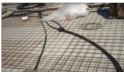
Figura 3: Tubulações embutidas na laje