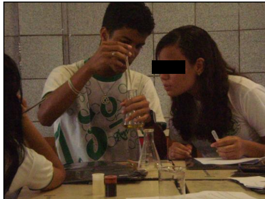
Figura 4: Os alunos em atividade