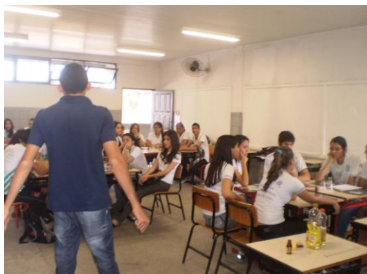
Figura 3: Intervenção do professor/bolsista

Observamos ainda que as aplicações das oficinas temáticas contribuíram para incluir os alunos no desenvolvimento das atividades. Verificamos que todos os alunos participaram ativamente da oficina, respondendo, realizando e questionando sobre o que estava sendo desenvolvido nas atividades, o que permitiu uma compreensão maior dos conceitos químicos trabalhados. Portanto além de as oficinas temáticas despertaram o interesse em aprender e estudar Química, elas também contribuíram para inclusão dos alunos, a integração e a negociação de significados sendo uma ferramenta que pode ser utilizada pelos professores do ensino médio para motivar e contribuir para dar significado ao que é ensinado. As figuras 3 e 4 representam respectivamente as intervenções realizadas por um dos professores/bolsistas durante a aplicação das oficinas temáticas, e os alunos realizando as atividades.