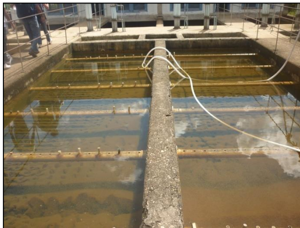
Figura 3: Decantadores da ETA. Muito lodo nas chicanas, o que indicam que provavelmente não fazem a limpeza periódica das mesmas.

➤ Decantação: É processo de separação dos flocos pela ação da gravidade. Os sólidos presentes na água são depositados no fundo do decantador, de onde o lodo acumulado deve ser removido periodicamente na operação de limpeza (Figura 3).