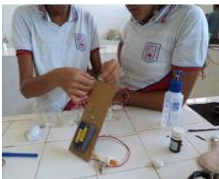
Figura 1. Aparelho para medida de ddp confeccionado pelos discentes do Colégio Estadual Presidente Costa e Silva, Aracaju-SE.

A confecção do aparelho para medida de ddp motivou o aluno a aprofundar seu conhecimento mediante a realização de pesquisas intensivas sobre os vários tipos de aparelhos já propostos na literatura, de modo a que fosse montado um aparelho para medida de ddp com materiais disponíveis na escola, de baixo custo e fácil obtenção. A Figura 1 apresenta o aparelho confeccionado pelos discentes.