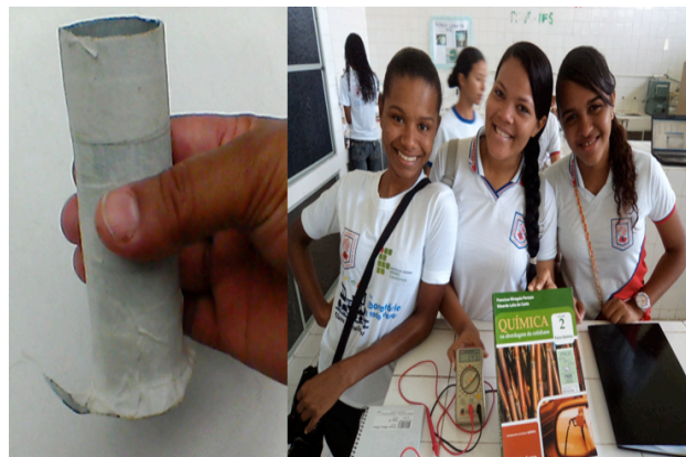
Figura 4. Experimento e alunos participantes do projeto.

A confecção das pilhas secas teve como diferencial a utilização do sumo de limão como substituto do cloreto de amônio que convencionalmente é utilizado na pilha de Leclanché, a mesma foi reproduzida pelos alunos seguindo a apostila desenvolvida pelos bolsistas. Ao final da prática os alunos puderam observar a reprodução da Pilha de Leclanché e realizar o estudo de oxidação-redução, além de aprimorar o conhecimento prévio e construir o conceito científico. A utilização das práticas torna-se muito importante no ensino de química permitindo a compreensão de como a química é desenvolvida.