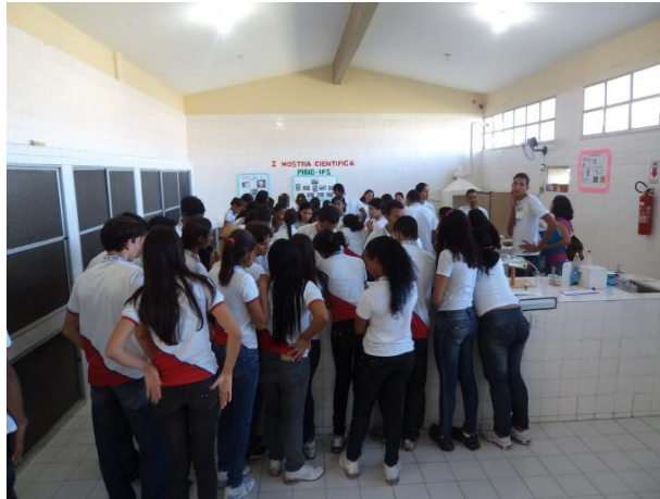
Figura 3. Mostra científica ocorrida no laboratório do Colégio Estadual Presidente Costa e Silva, Aracaju-SE.

Após a apresentação do projeto na Mostra Científica houve um aumento significativo na procura de novos discentes quanto a participação no projeto, cerca de 137%.